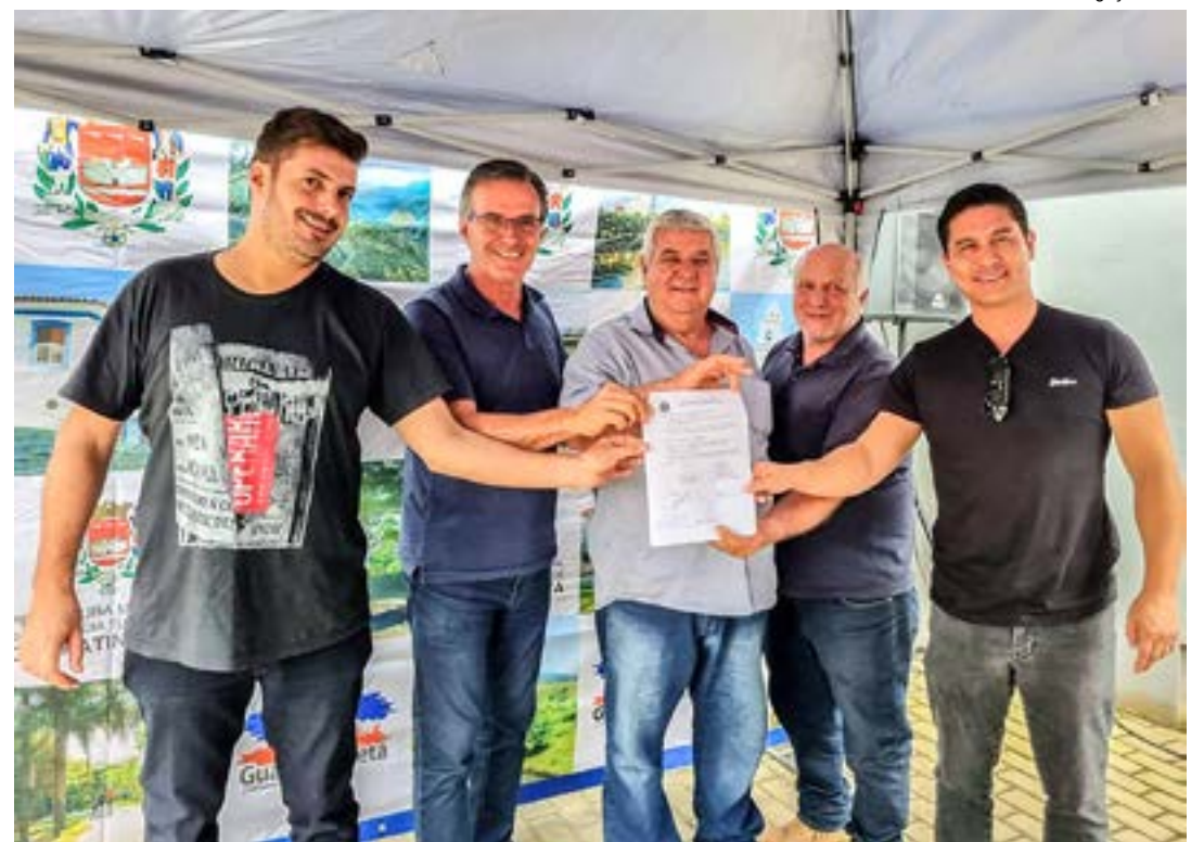
Reunião em Guaratinguetá para assinatura de convênios para obras de pavimentação de estradas na cidade

Na oportunidade da assinatura dos convênios de pavimentação, a gestão também firmou outra parceria com o Estado, por meio do Dade (Departamento de Apoio ao Desenvolvimento das Estân-