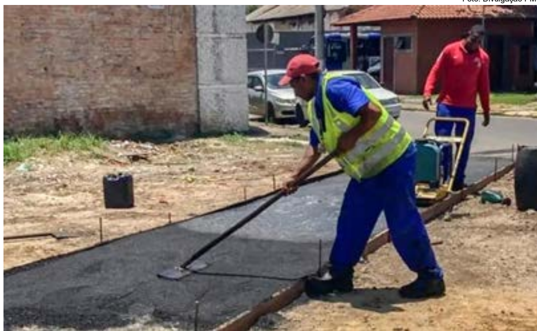
Obra para implantação de ciclovia, que vai atender a região central de Cruzeiro; Guará também tem projeto

A melhoria será viabilizada através de uma parceria entre o Município e o Detran (Departamento Estadual de Trânsito), por meio do Programa Respeito à Vida. Apesar da solicitação do Jornal Atos à Prefeitura de Cruzeiro, o