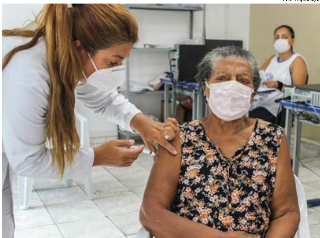
Vacinação de idosa durante campanha contra Covid-19; região volta a registrar alta de contaminações