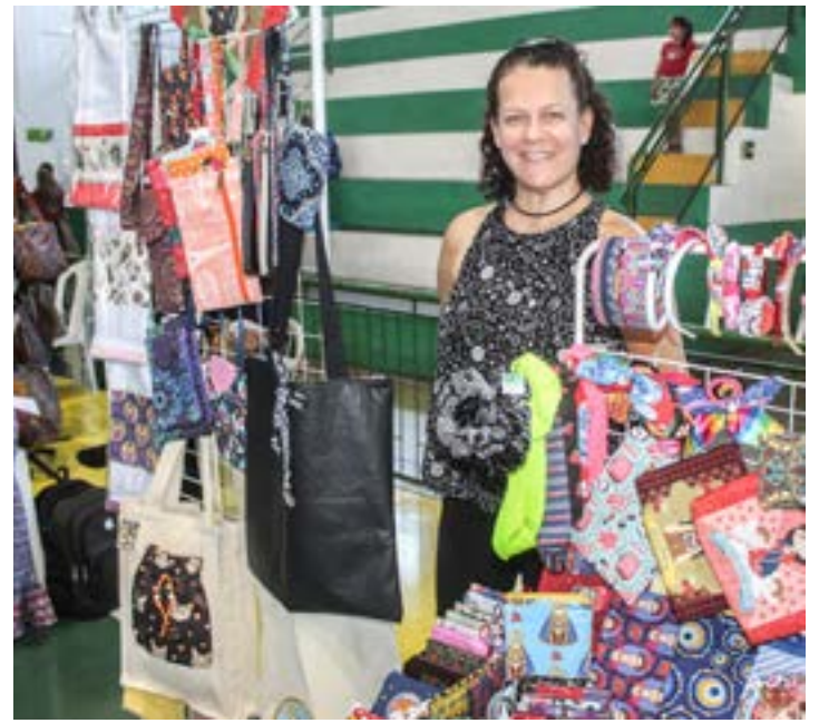
Feira de artesanato em Pinda; expectativa é de três mil visitantes