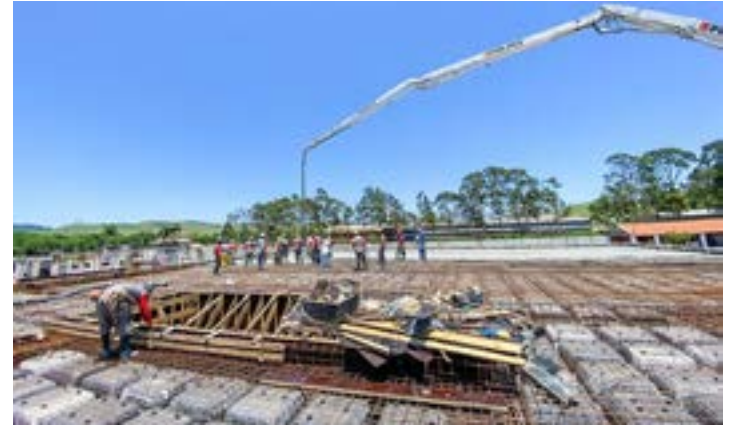
Trabalho na construção do Hospital Regional; anúncio de ampliação