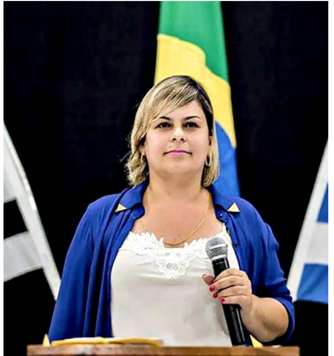
A prefeita de Ubatuba, Flavia Pascoal, teve o mandato cassado por contrato irregular na compra de pães para a merenda escolar