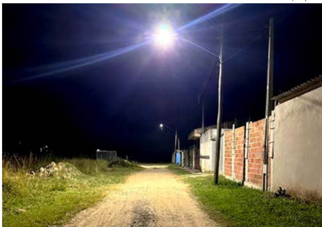
Lâmpada LED instalada em Aparecida; cidade avança nas trocas de lâmpadas com recursos do Estado