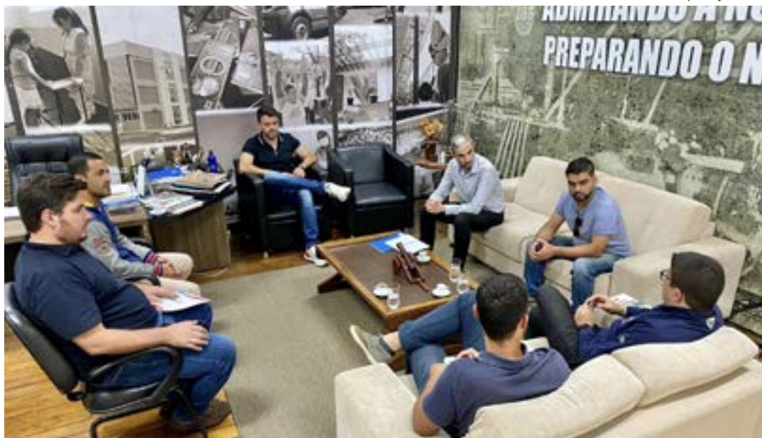
Reunião entre representantes de Cruzeiro e de Passa Quatro tratou sobre linha de ônibus para ligar as cidades

Em uma postagem realizada na manhã da quinta-