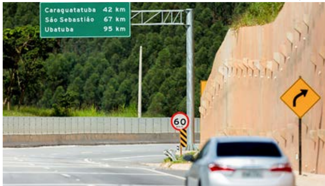
Rodovia dos Tamoios, que garante acesso ao Litoral; Estado discute alternativas para acessibilidade