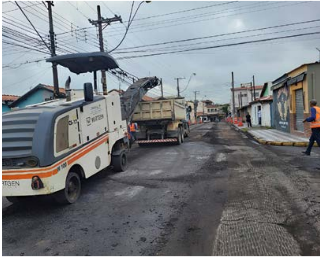
Trabalho na avenida Nossa Senhora de Fátima, no Bairro da Cruz; Lorena investe em megaobra pelas vias

Até o momento, foram concluídos os serviços nas avenidas Targino Vilella Nunes e Francisco Brasil, que ficam no bairro Vila Nunes, rua Doutor João Pinto Antunes, no bairro