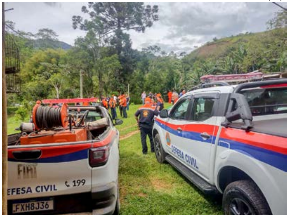
Trabalho da Defesa Civil em Pindamonhangaba; Prefeitura estuda criação de plano de emergência na cidade

A Defesa Civil de Pindamonhangaba conta com uma equipe de dez agentes e 96 voluntários treinados.