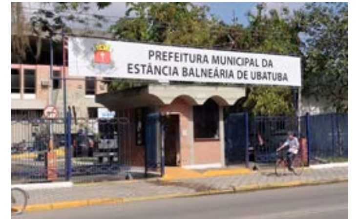
Prefeitura de Ubatuba desmentiu fake news sobre concurso