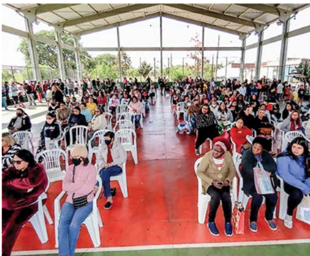
Entrega das escrituras dos imóveis aos moradores do bairro Vila São Benedito; Pinda finaliza regularização