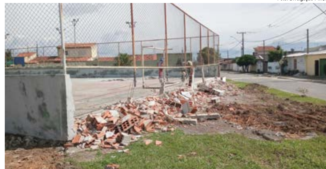
Início de reforma na quadra do Bela Vista, em Canas; obra tem investimento de R$ 77 mil e entrega até julho