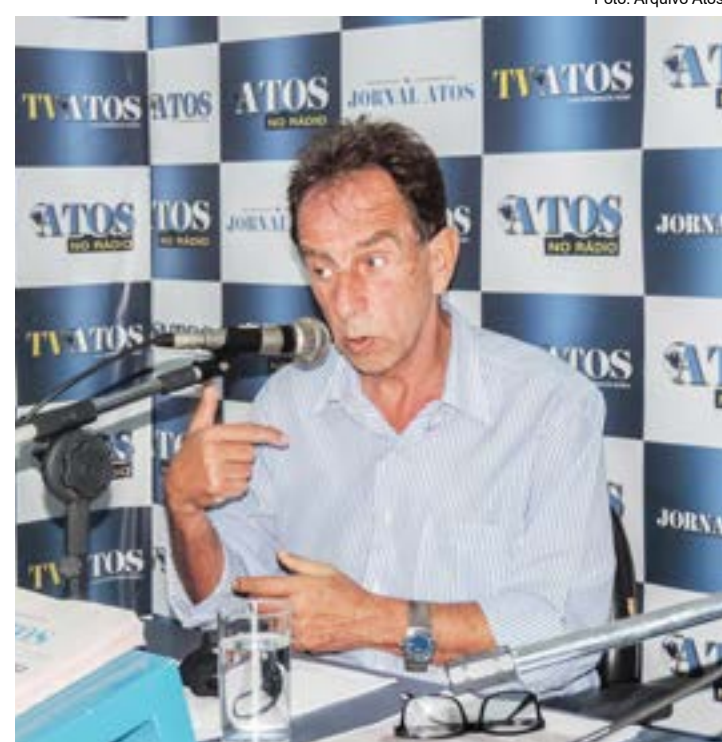
O prefeito Piriquito, que teve pedido de arquivamento de denúncias