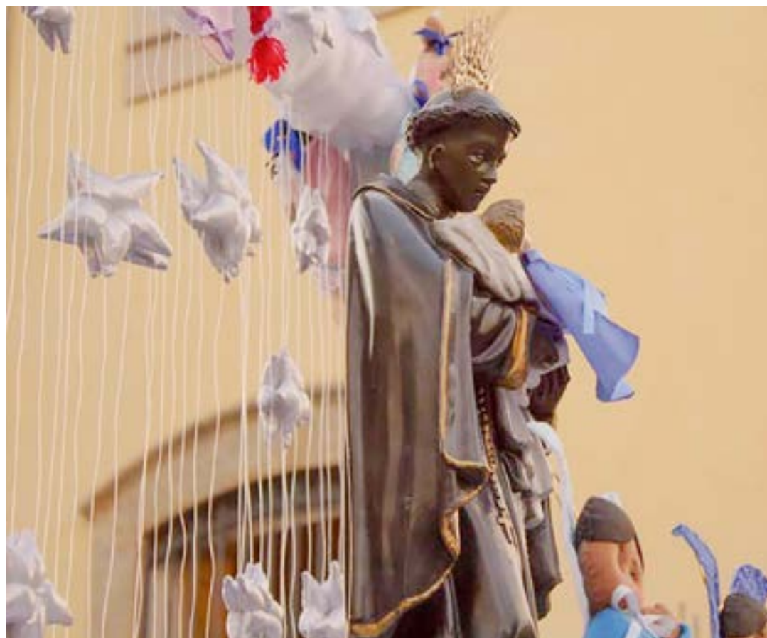
A imagem de São Benedito, foca de festas pela região; Lorena realiza versão rural das comemorações

A tradicional cultura de eventos beneditinos, comemorada regionalmente ao longo do mês de abril, tem características muito próximas à RMVale (Região Metropolitana do Vale do Paraíba e Litoral Norte). Durante o mês, foram realizadas uma série de festas, com destaque para Pindamonhangaba e Guaratinguetá, cidades onde São Benedito é o padroeiro católico e onde a segunda-feira pós-Pascoa (uma das datas comemoradas