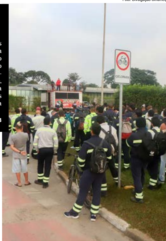
Manifestação em frente à Confab por repasse da PLR a funcionários