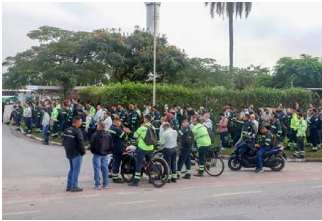
Protesto de funcionários da Confab nesta terça-feira, em Pinda; ação, que pede para empresa recalcular o PLR