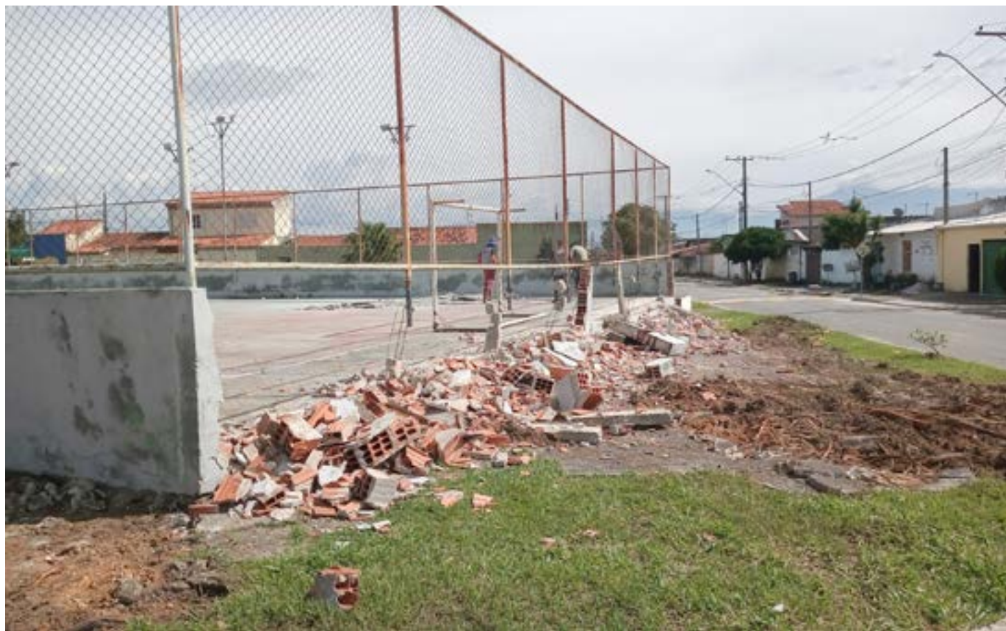
Início de reforma na quadra do bairro Bela Vista, em Canas; obra tem investimento municipal de R$ 77 mil e expectativa de entrega até julho