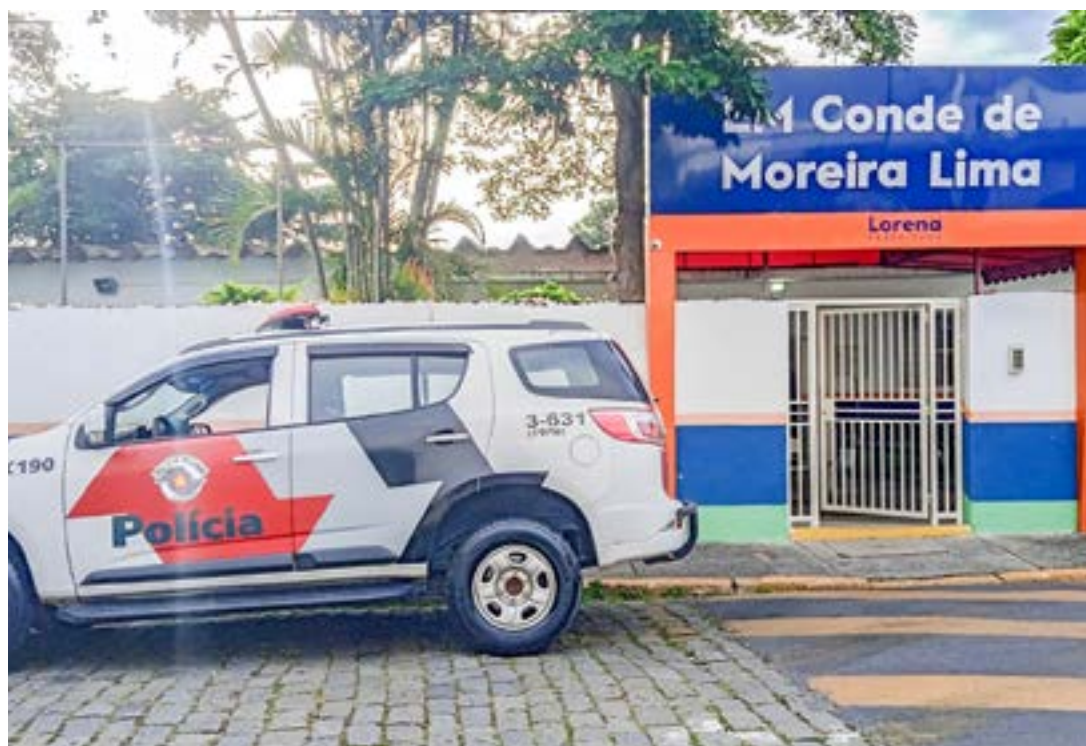
Polícia Militar amplia ação de policiamento nas escolas pela região; municípios, Estado e União debatem