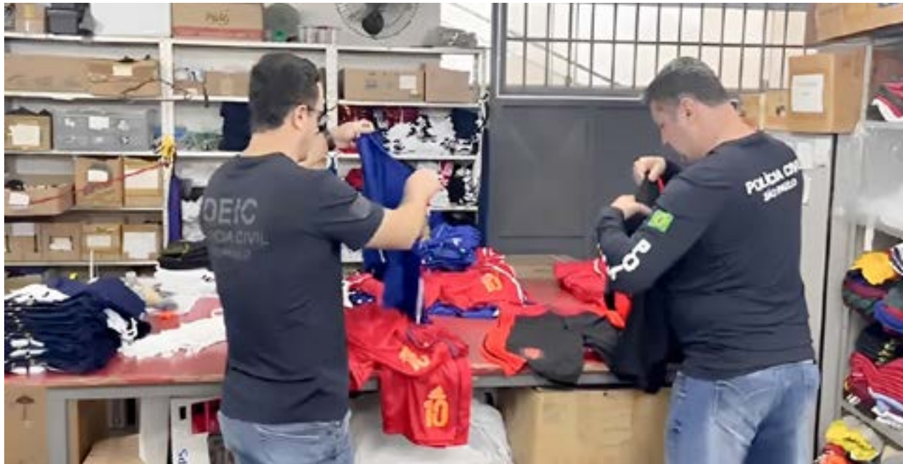
Operação do Deic da Polícia Civil contra a pirataria, que apreendeu produtos esportivos falsificados em Aparecida e Potim