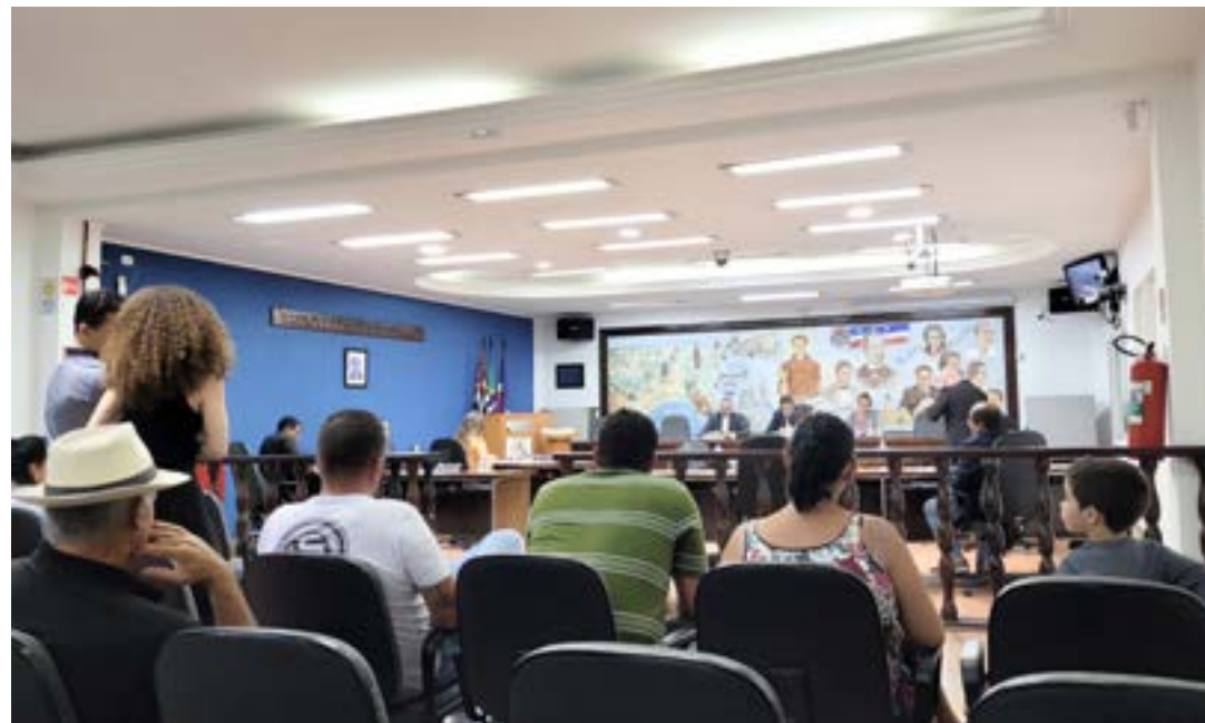
Famílias vão à sessão da Câmara de Guará pedir apoio a vereadores para garantir segurança nas escolas