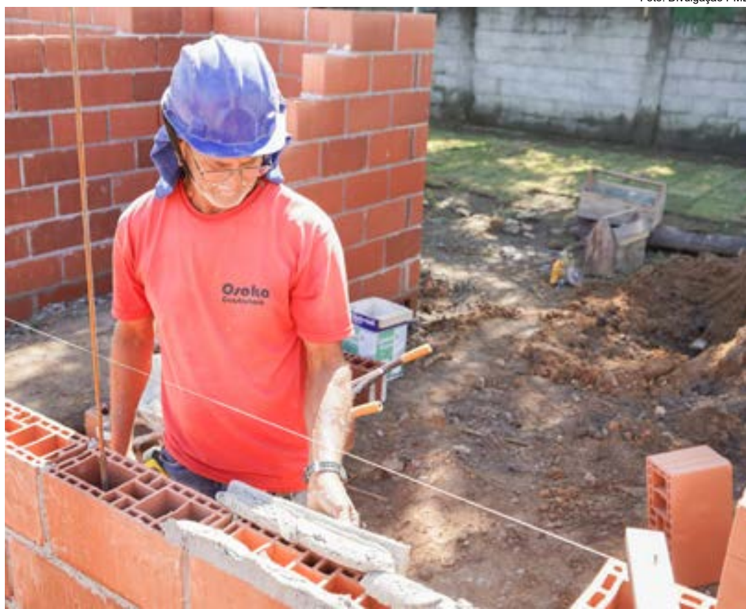
Construção da UBS do bairro Vila Passos, unidade facilita o atendimento de aproximadamente mil famílias

Inicialmente prevista para ser concluída até o fim de junho deste ano, a obra foi viabilizada através de um investi-