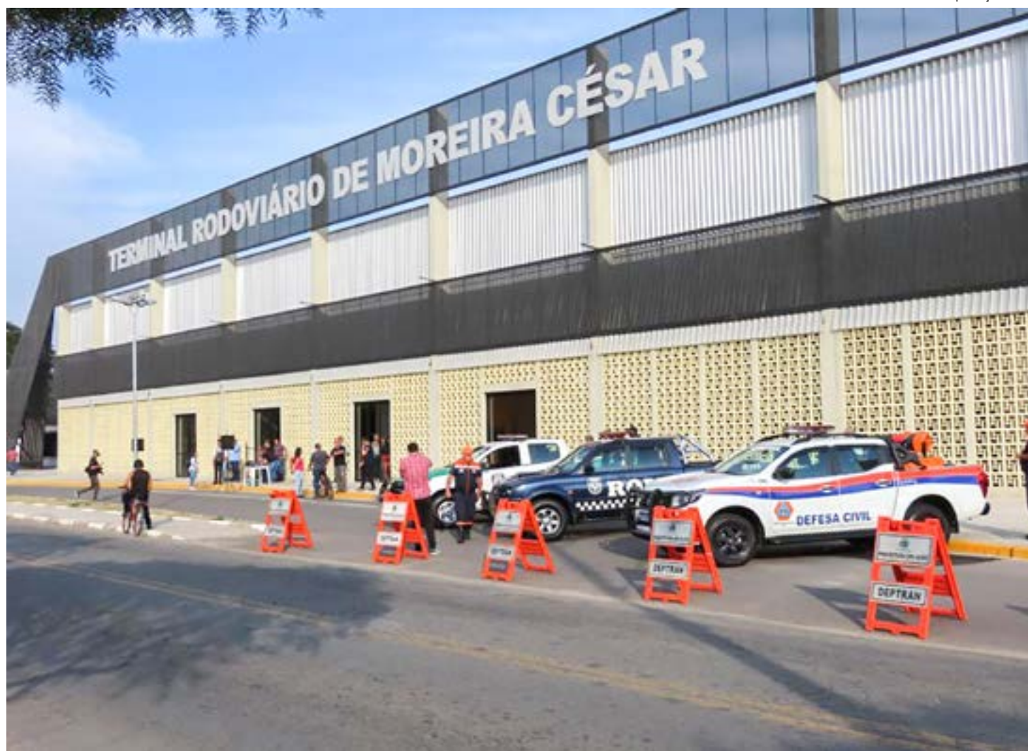
Terminal Rodoviário, inaugurado em 2022, em Moreira César; Prefeitura de Pindamonhangaba dá últimos dias de inscrição para espaço comercial

rir mais detalhes do chamamento público podem acessar seu edital pelo endereço pindamonhangaba.sp.gov.br/secretarias/subprefeitura .