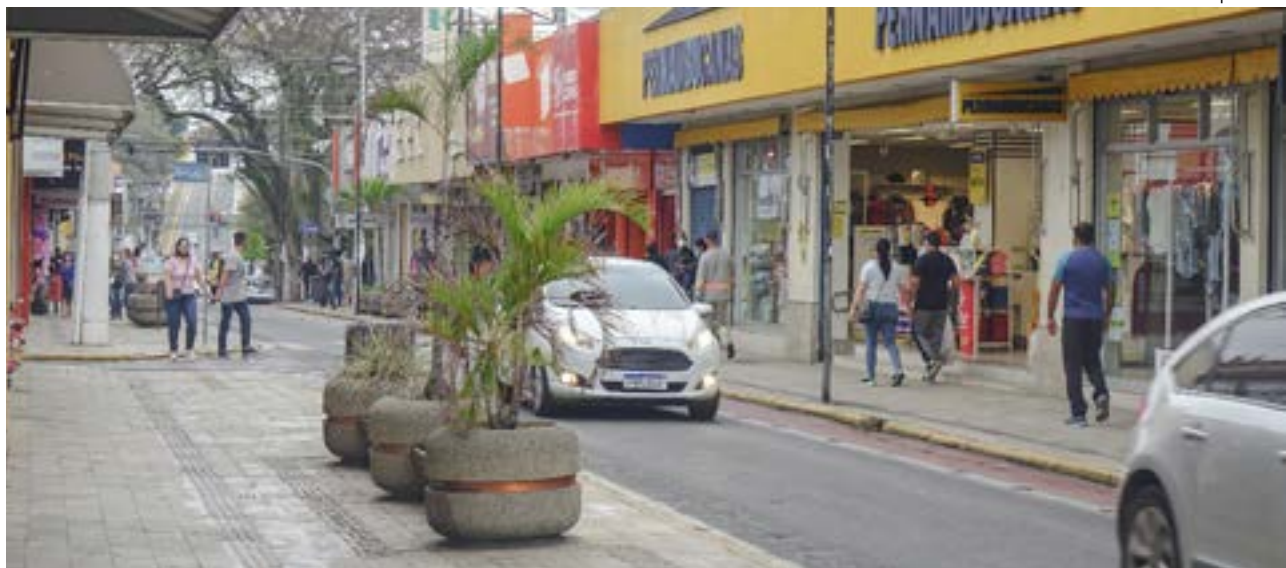
Centro da cidade de Pindamonhangaba; setor comercial aponta liderança da cidade na geração de empregos da região