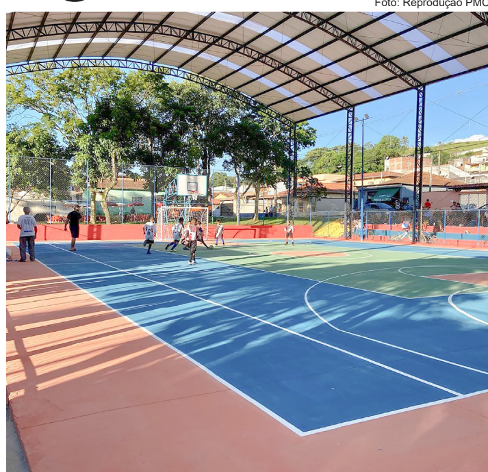
Nova quadra no Itagaçaba, reforma com investimento de R$ 350 mil

De acordo com o Executivo, a reforma do espaço público consistiu na implantação de uma estrutura de cobertura, troca de piso, pintura e adequação de alambrados.