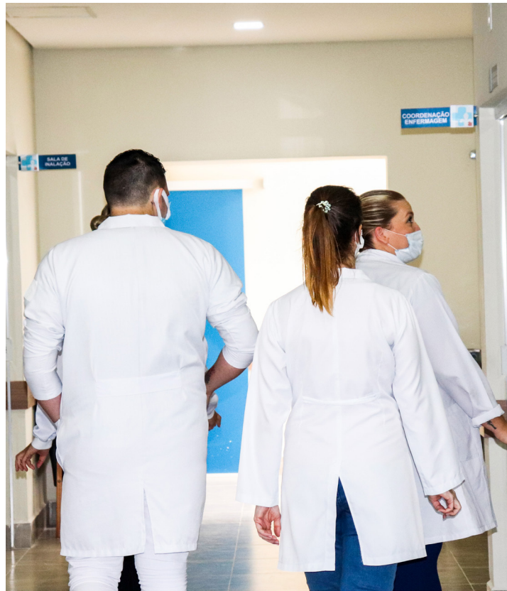
Atendimento médico na cidade de Lorena; projeto pedia serviço noturno