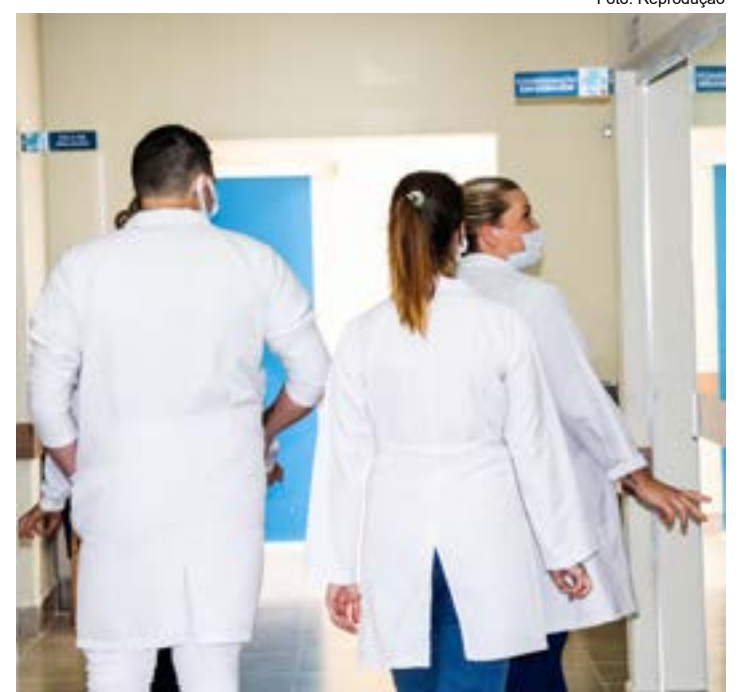
Atendimento médico na cidade de Lorena; projeto pedia serviço noturno