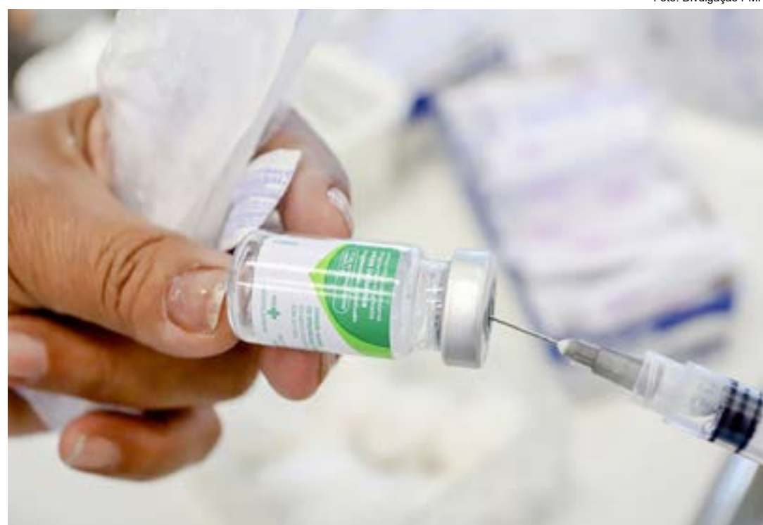
Vacinação trivalente contra a gripe em Pindamonhangaba; atendimento será iniciado na próxima terça-feira