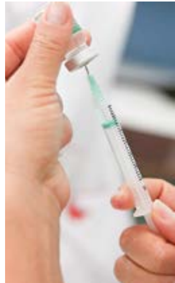
Vacinação contra gripe em Pinda

A vacinação anual contra a gripe (Influenza Trivalente) terá início na terça-feira (11) em Pindamonhangaba. Segundo a secretária de Saúde, a mudança no calendário nacional de segunda para o dia seguinte foi motivada pelo feriado de São Benedito, padroeiro da cidade.