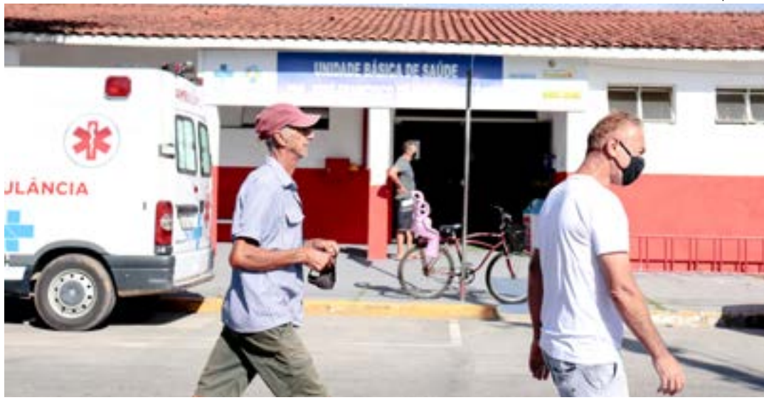
Pacientes procuram unidade de saúde em Potim; cidade enfrenta desafios contra o mosquito Aedes aegypti

O caso foi registrado em março, mas a confirmação só foi feita nesse mês. A pessoa