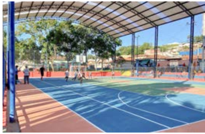
Nova quadra no Itagaçaba, reforma com investimento de R$ 350 mil

Após um investimento de cerca de R$ 350 mil, a Prefeitura de Cruzeiro reinaugurou no último fim de semana a praça poliesportiva do bairro Itagaçaba. A modernização do espaço público busca oferecer melhores condições para que os moradores realizem práticas esportivas.