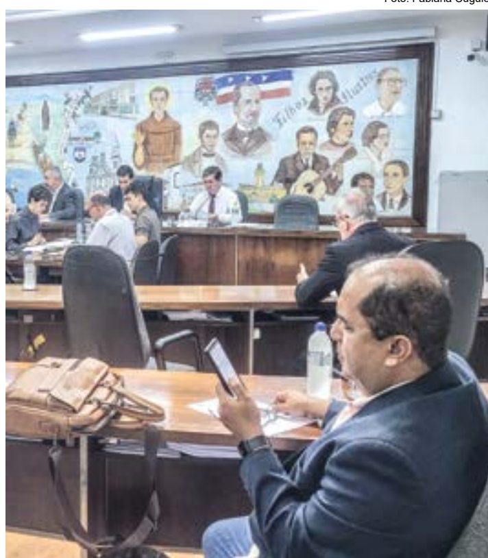
Sessão em Guaratinguetá; vereadores definem área para nova sede