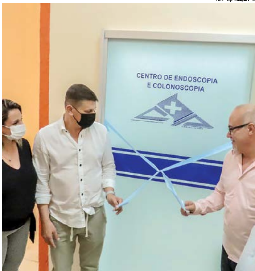
Inauguração do centro de exames da Santa Casa de Pinda; que vai contribuir para diminuir fila de espera