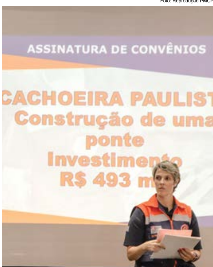
Apresentação de projeto para ponte do Turma 26; convênio fechado