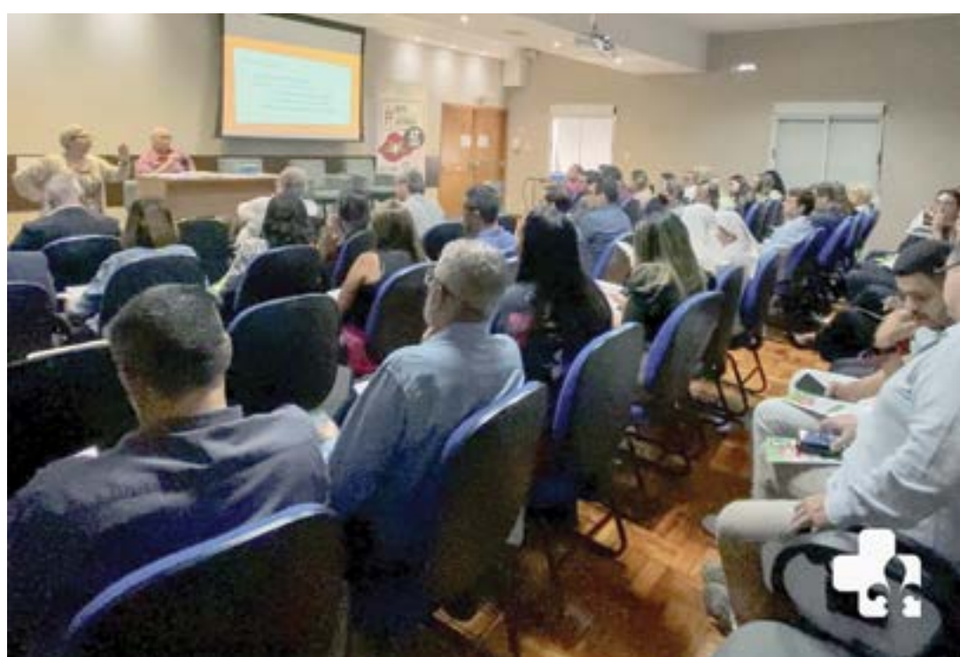
Evento realizado pela Fehosp, na Santa Casa de Lorena; debate foca condições de hospitais filantrópicos