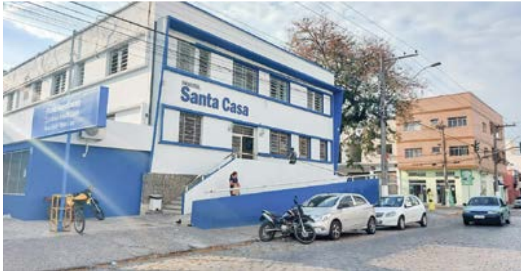
Santa Casa de Cruzeiro registrou óbito, na quarta-feira, com caso suspeito de dengue hemorrágica

De acordo com o hospital, foram realizados todos os procedimentos possíveis para estabilizar o paciente, mas ele foi a óbito. O diag-