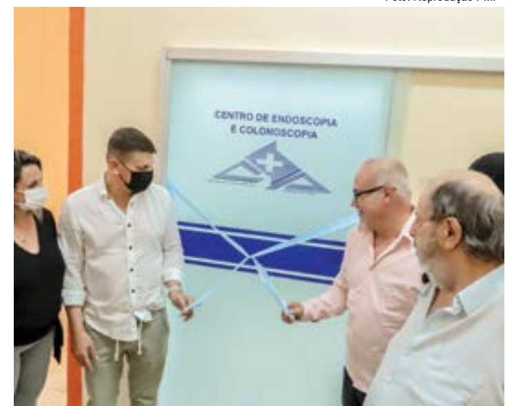
Inauguração do centro de exames da Santa Casa; meta é reduzir filas

O prefeito ressaltou a importância do funcionamento do novo setor do hospital e a ampliação do oferecimento de consultas em quatro especialidades médicas. "Vamos diminuir o tempo de espera.