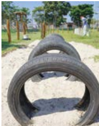
Brinquedos do ParCão de Lorena

A secretaria de Obras de Lorena anunciou a instalação um espaço de lazer para pets no Parque Ecológico do Mondesir, o ParCão, um local com várias atividades para cães acompanhados de seus tutores.