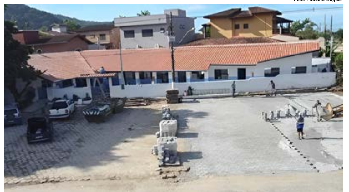
Escola do bairro Lagoinha, em Ubatuba, devolvida para crianças da comunidade após reforma de R$ 520 mil