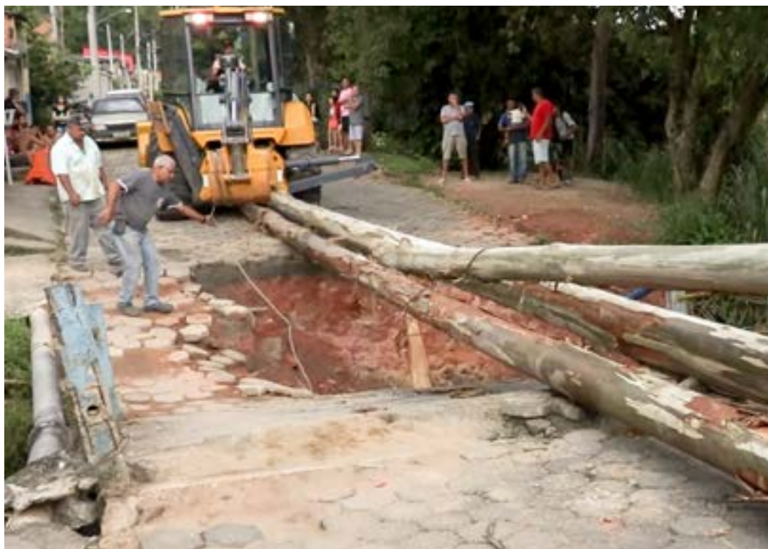
Trecho de ponte que cedeu após fortes chuvas que atingiram Cachoeira Paulista neste começo de semana

Desde a quinta-feira (19), as mais de 150 famílias do Turma 26 convivem com os transtornos causados pela queda da ponte utilizada para terem acesso à região central da cidade. Não podendo contar com o ponto de passagem, os moradores desde então são obrigados a utilizarem uma rota alterna-