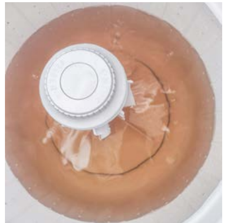
Água amarelada flagrada por moradora de Lorena no último sábado

Beber água é uma das atividades mais saudáveis no dia a dia, mas em alguns bairros de Lorena, a prática ficou perigosa no último final de semana. Moradores da cidade entraram em contato com a redação do Jornal Atos para reclamar da coloração amarela da água fornecida pela