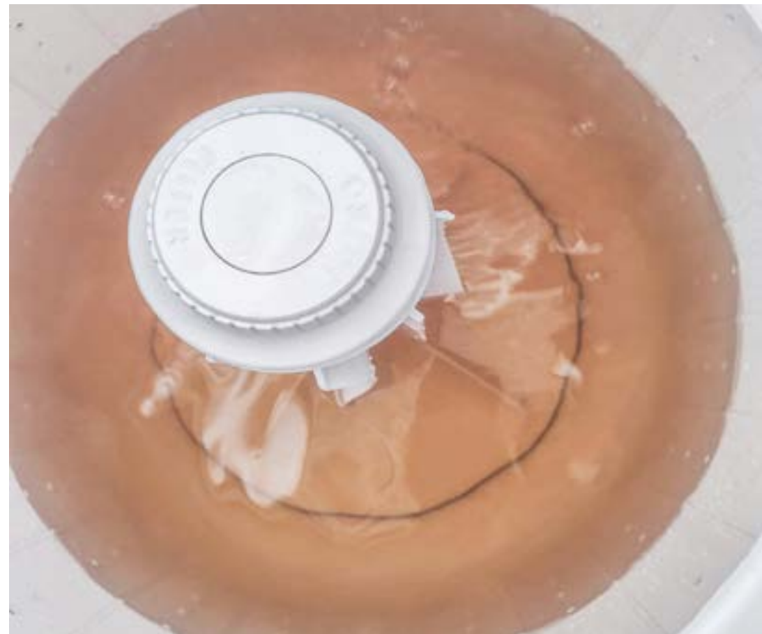
Água amarelada em Lorena; Sabesp informa que manutenção pode ter causado mudança no padrão visual