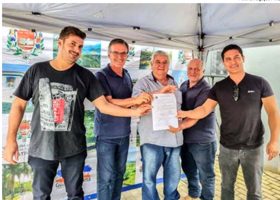
Reunião em Guaratinguetá para assinatura de convênios para obras de pavimentação de estradas na cidade

Na oportunidade da assinatura dos convênios de pavimentação, a gestão também firmou outra parceria com o Estado, por meio do Dade (Departamento de Apoio ao Desenvolvimento das Estân-