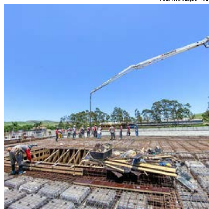
Trabalho na construção do Hospital Regional; anúncio de ampliação