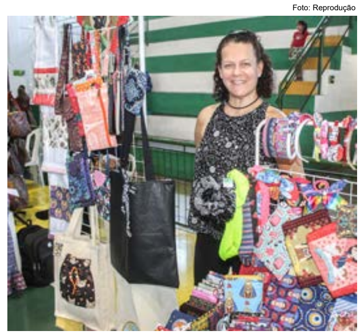
Feira de artesanato em Pinda; expectativa é de três mil visitantes