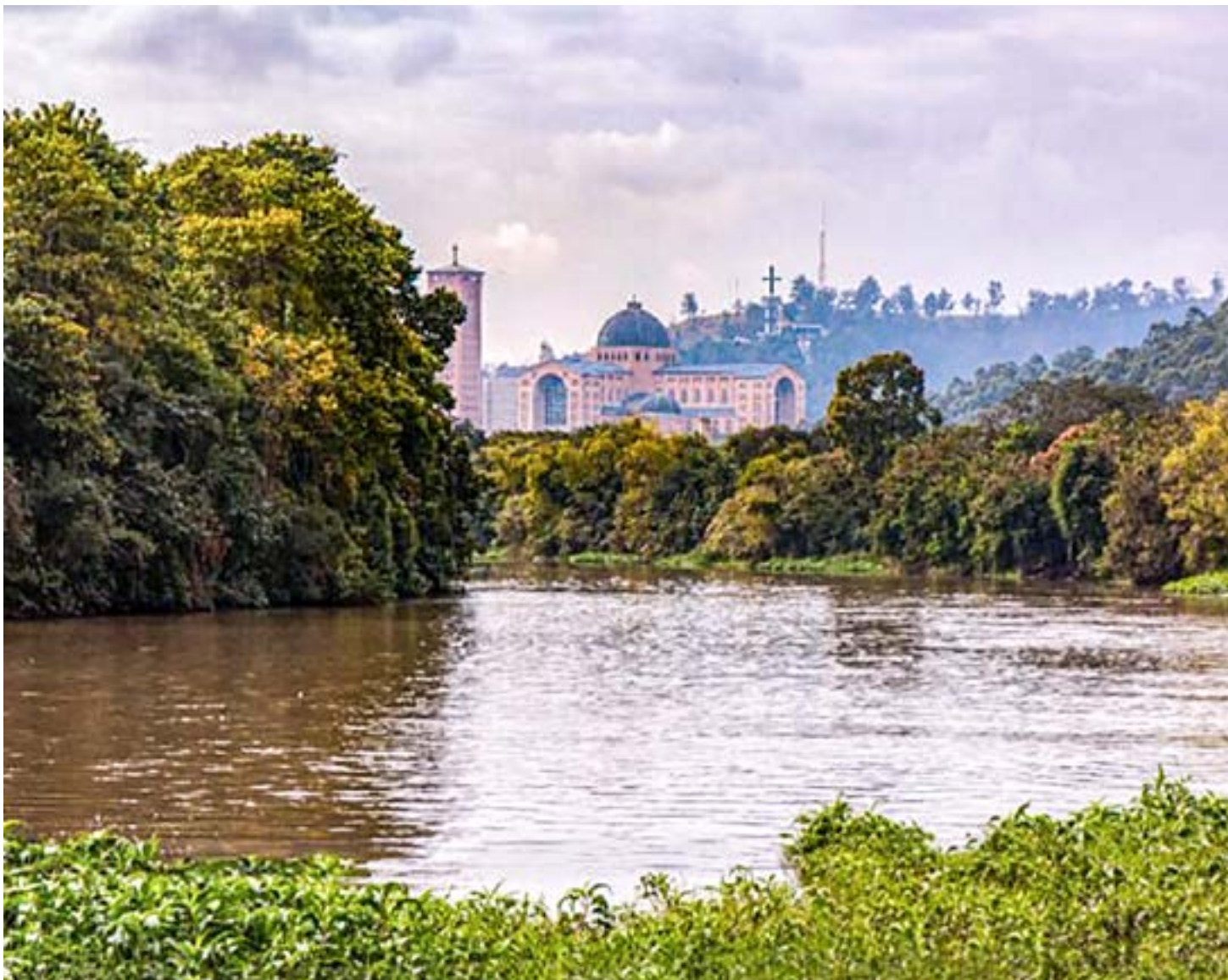
Rio Paraíba do Sul, foco de projeto que faz parte de parceria entre o Santuário Nacional e o SOS Mata Atlântica, com foco na água oferecida

No último dia 23, uma capacitação foi realizada com os voluntários e a primeira amostra foi recolhida. Segundo o biólogo e educador da SOS Mata Atlântica, Cesar Pegoraro, a pesquisa trará a luz para sociedade sobre um assunto que precisa de atenção. "Não é digno que a gente tenha tão lindo, tão grande e historicamente importante como o Rio Paraíba do Sul recebendo esgoto 'in