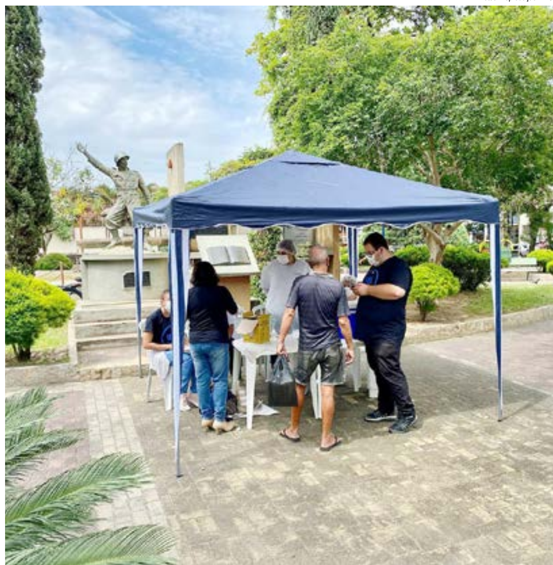
Posto volante de vacinação na praça 9 de Julho, em Cruzeiro; cidade amplia atendimento contra a Covid-19

Segundo a última atualização do vacinômetro local, 76,14% da população cruzeirense recebeu a primeira dose contra a doença, 66,63% completaram o esquema vacinal com a segunda e outros 2,52% receberam a dose única.