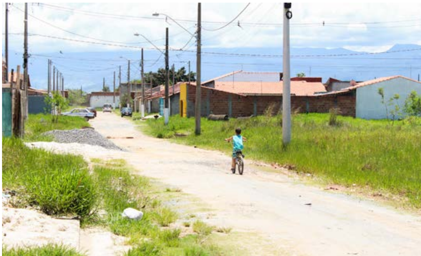
Menino passeia de bicicleta pela rua sem pavimentação, na Vila Rica; bairro atendido em anúncio era foco de reclamações de moradores há anos

A outra ordem de serviço, no valor de R$ 480,6 mil, garante a pavimentação parcial, com asfalto, da avenida México e as ruas 26 de Agosto e Panamá, enquan-