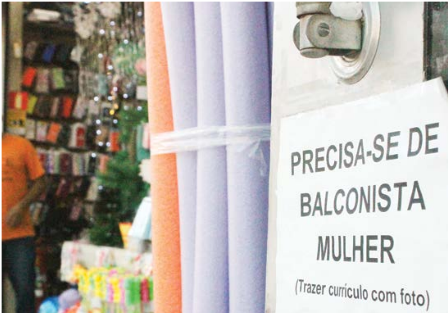
Cartaz indica vaga para contratação de mulheres no comércio de Guaratinguetá; setor puxou crescimento da geração de emprego na região

“O que oferece emprego, mão de obra, é o comércio ativo. Nós tivemos mais de 80% de desempregados em Aparecida, porque todos trabalham em hotéis, lojas, bancas. Nós não temos empresa, temos que aprender a conviver com a realidade e essa oferta de emprego só terá quando os peregrinos voltarem, e é isso que está acontecendo. Os hotéis estão voltando a contratar, os