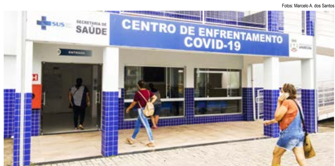
Centro de Enfrentamento à Covid-19 de Aparecida; cidade anuncia fechamento de leitos para novembro

Queda de internações é motivo para encerramento de ala; enfermagem também tem planejado fechamento em novembro