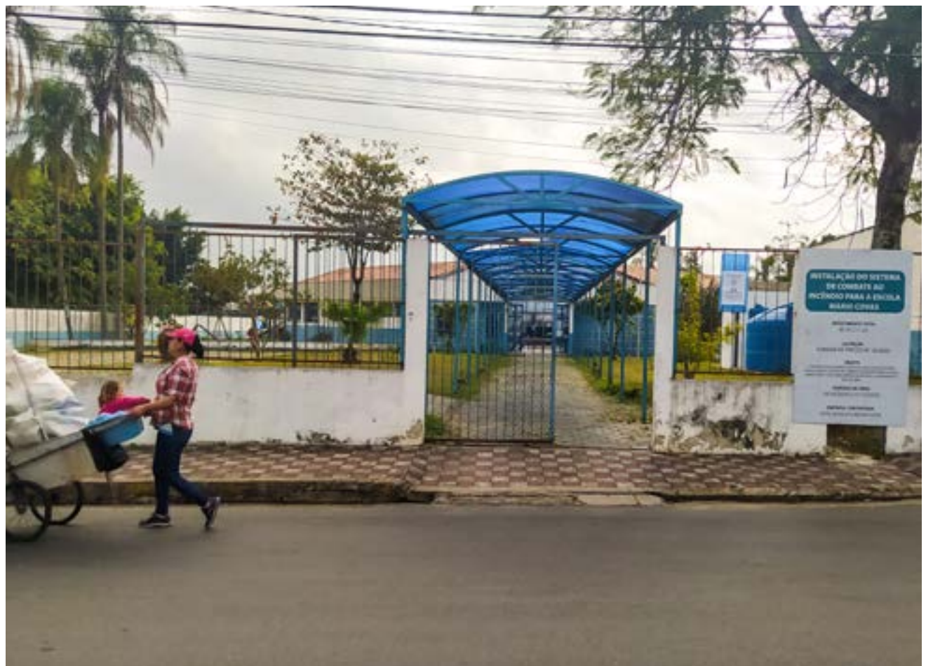
Frente da escola municipal Mário Covas, no Bairro da Cruz, uma das unidades que se prepara para receber alunos no próximo dia 16