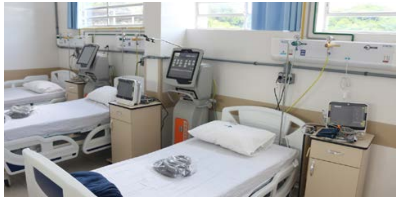
Leito utilizado para o atendimento contra a Covid-19; repasse de R$ 1 milhão deve reforçar estrutura para atendimento na rede

Sessão extraordinária contou com votação sobre projetos de apoio à administração; R$ 152,7 mil para novos equipamentos