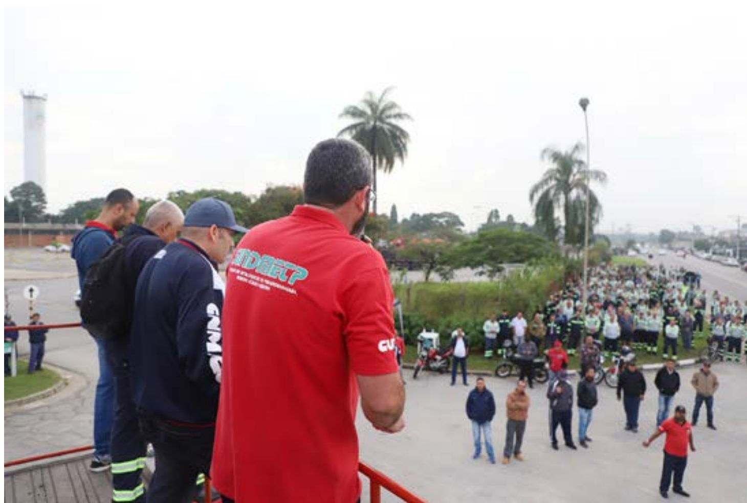
Funcionários da Tenaris que decidiram não seguir com greve após nova proposta apresentada pela empresa em Pindamonhangaba

Além da abertura de uma negociação com a direção da empresa, que emprega quase mil funcionários, na ocasião o sindicato alegou que cinco das demissões foram irregulares,