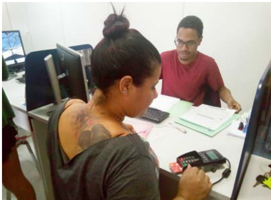
Contribuinte busca setor tributário para acertar impostos; serviços têm novas modalidades de pagamento

Tributos podem ser pagos pelo cartão de crédito e débito; medida busca conter inadimplência