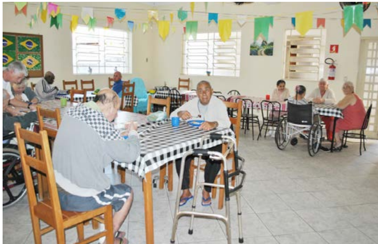
Idosos assistidos pelo asilo São Vicente de Paulo; projeto aprovado na Câmara beneficiará entidade com troco do comércio de Cruzeiro